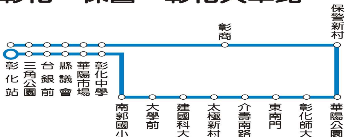
彰化市區公車 2路 彰化→保警→彰化火車站