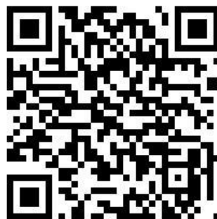
客家歌謠合唱曲譜選集 II 下載網址